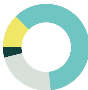
Répartition des inscriptions pour l'année 2021-2022